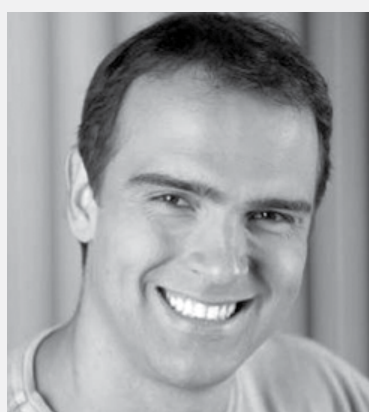
“Sempre quis ser ídolo” Tadeu Schmidt