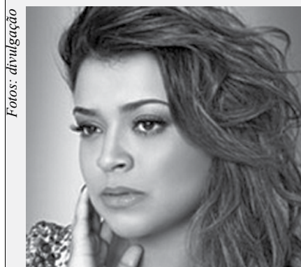
“Brega é rotular as pessoas de cafona” Preta Gil