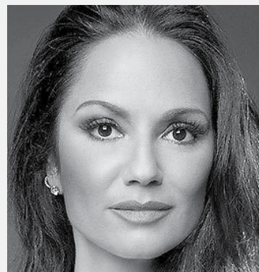
“Nunca chove homem na minha horta” Luiza Brunet