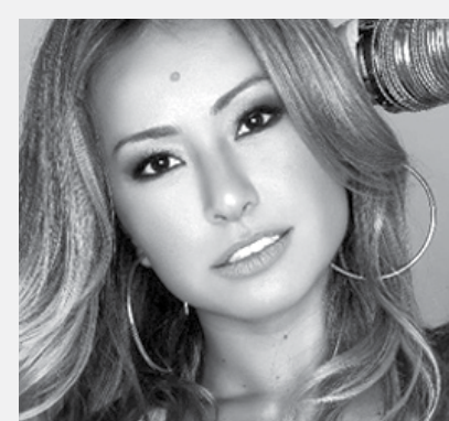
“Não faço dieta! Fome me tira do sério” Sabrina Sato